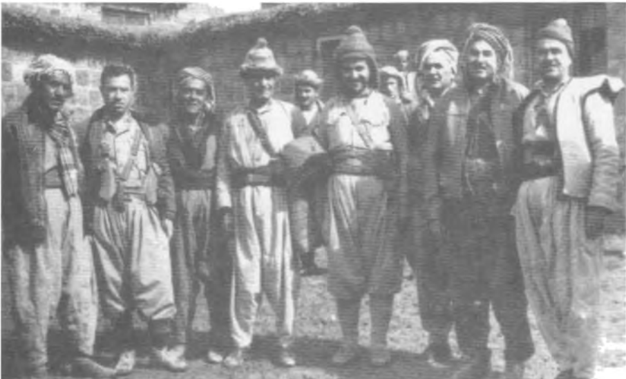
له‌گه‌ل کۆمه‌لێک ینشمه‌رگه سه‌ره‌تای ۱۹۶۳